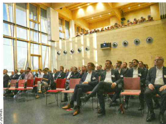
Die Vorträge des Jowat-Symposiums fanden 2018 erstmals im Audimax des neuen „Haus der Technik“ statt.

Das neue Innovations- und Anwendungszentrum beherbergt auf einer Grundfläche von 2500 Quadratmetern die Abteilungen Forschungsdienste mit mehreren Laboren, die Anwendungstechnik für die Kunden sowie Ausstellungs- und Schulungsräume. Zwei Maschinenhallen ermöglichen unter anderem Anwendungen in der Kantenklebung, Ummantelung sowie Flächen- und 3D-Kaschierung. Insgesamt bietet das Haus der Technik Arbeitsplätze für 45 Mitarbeiterinnen und Mitarbeiter. Das in Holzleimbauweise entstandene Bauprojekt ist auch architektonisch außergewöhnlich: Die auf dem Sockel stehenden Staketen verbinden als symbolisierte