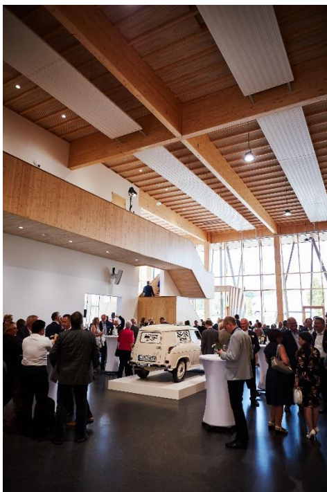
Bild 2: Festakt zum 100-jährigen Bestehen der Jowat SE am Freitag im neuen Haus der Technik